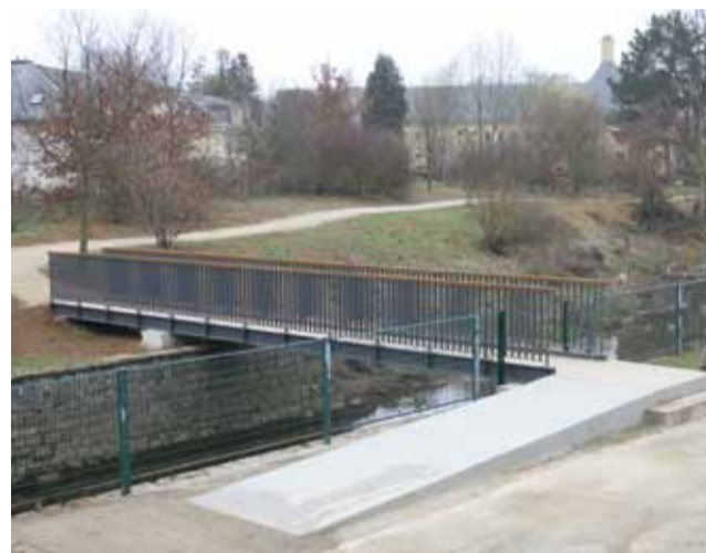
Neue Fußgängerbrücke und Spazierweg beim Schwimmbad Nouvel chemin piétonnier avec passerelle près de la piscine