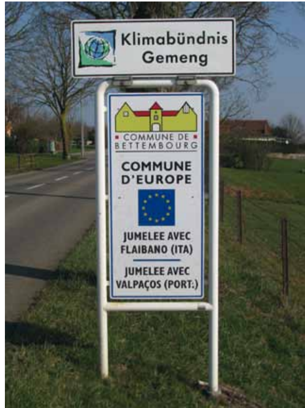
Neue Hinweisschilder am Eingang unserer Ortschaften Nos Jumelages: renouvellement des panneaux à l'entrée des villages