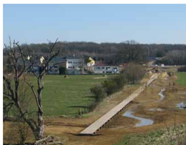
Neuer Zugang zum künftigen Park Krakelshaff Première amorce du futur parc Krakelshaff