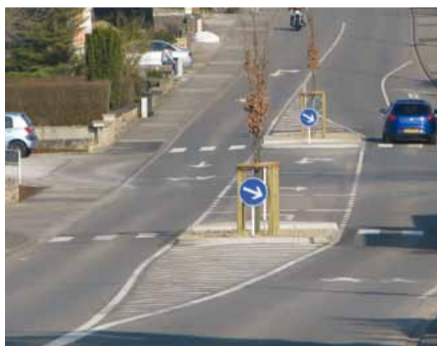
Maßnahmen zur Verkehrssicherheit von Fußgänger und Autofahrer / Mesure de sécurité pour piétons et automobilistes