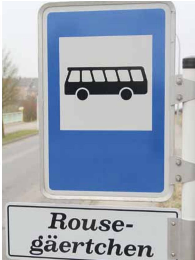
Beschilderung aller Bushaltestellen Signalisation de tous les arrêts bus