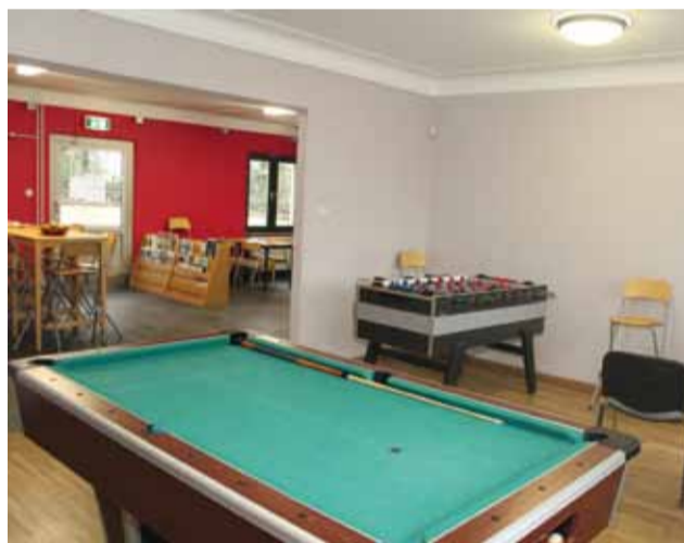
Renovation des Jugendhauses Rénovation de la Maison des Jeunes