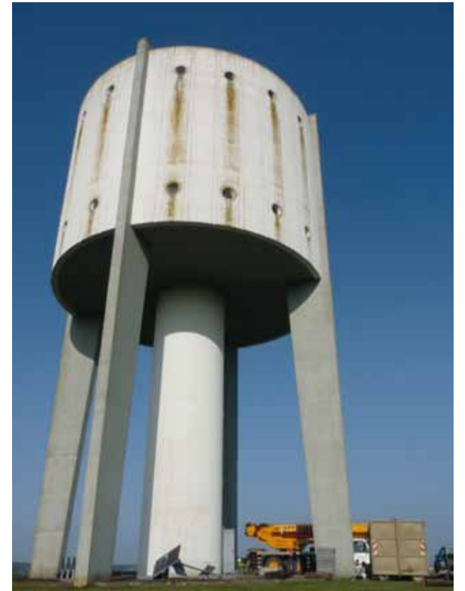
Renovierung und Modernisierung des Wasserturms in Nörtzingen - Rénovation et modernisation du bassin d'eau à Noertzange