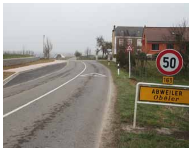
Neue Bushaltestelle in Abweiler Nouvel arrêt autobus à Abweiler

Die LSAP möchte hier einen schönen erholsamen Park anlegen, und nicht wie andere Parteien ein Fußballfeld, Schulraum oder sonstige verkehrsanziehende Infrastrukturen dorthin setzen.