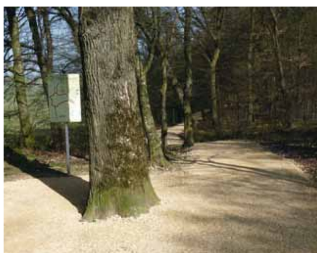
Instandsetzung des Fitness im "Moosselter" in Bettemburg Renovation du parcours fitness au "Moosselter" à Bettembourg